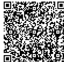
作品投稿用メール